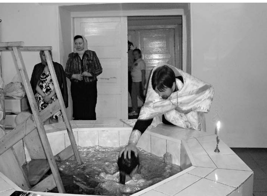
«Крещается раба Божия...»

бы познакомиться с этим интереснейшим диаконом. Эти все молодые люди приехали до 11 мая: кто взял отпуск, кто отгулы, а кто на все майские праздники прилетел впервые! Начали зеленеть деревья. Чувствуется дыхание весны.